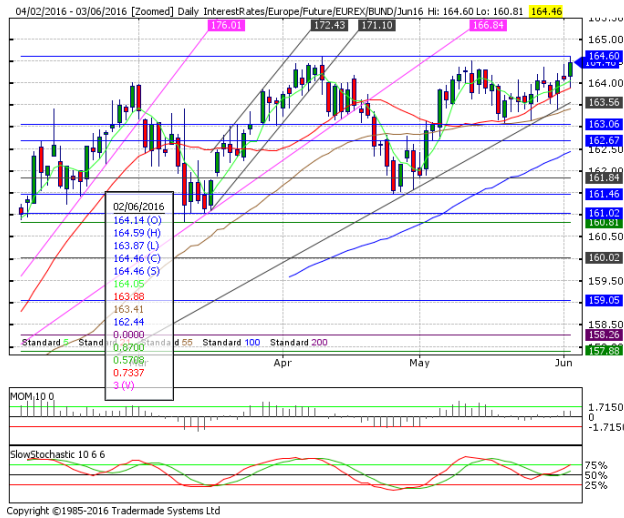
德國 10 年期國債：(M16) 壓力重返關鍵阻力位