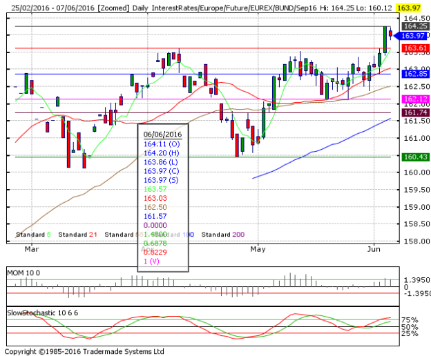
德國 10 年期國債：(U16) 整固週五上漲

阻力位 4：166.63 2月29日所創 2016 年和紀錄高點 阻力位 3：165.84 周包寧傑帶狀(Boll band)上軌 阻力位 2：165.51 2月24日低點，現為阻力位(連續) 阻力位 1：164.25 6月3日高點