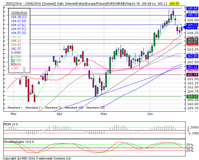
德國 10 年期國債：(U16) 21 日均線提供支撐