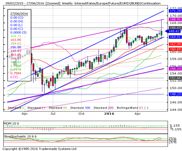
德國 10 年期國債：(U16) 周上升通道上軌抑制漲勢

阻力位 4：171.29 周上升通道上軌 2 阻力位 3：168.91 周上升通道上軌 1 阻力位 2：168.86 6月24日所創2016年和紀錄高點 阻力位 1：166.98 6月24日小時阻力位