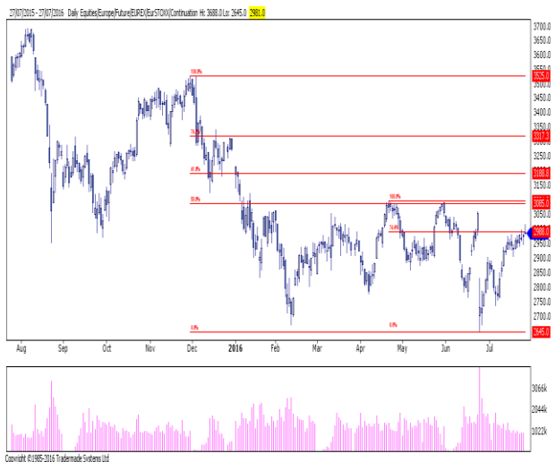
Euro Stoxx 50 指數：收盤墓碑十字星乃近期擔憂

評論：週二上破 166.87 確實令人鼓舞，這已令 U16 合約週三高見 167.61，略高於關鍵近期阻力位 167.54(76.4%斐波回檔位)。隨著收報 167.60，我們須觀察這一突破能否維持。不過，近期技術指標有所超買構成壓力。鑒於此，167.26/31 區域提供初始支撐，而 7月26日高點 167.03 對向下動力更為重要。