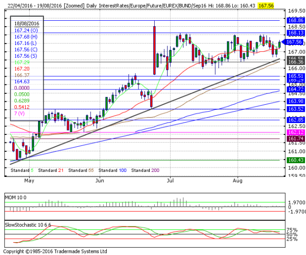
德國 10 年期國債：(U16) 自關鍵支撐區域反彈

阻力位 4：168.86 周上升通道上軌 1 阻力位 3：168.86 6 月 24 日所創 2016 年和紀錄高點 阻力位 2：168.79 周包寧傑帶狀(Boll band)上軌 阻力位 1：168.13 7 月 6 日高點