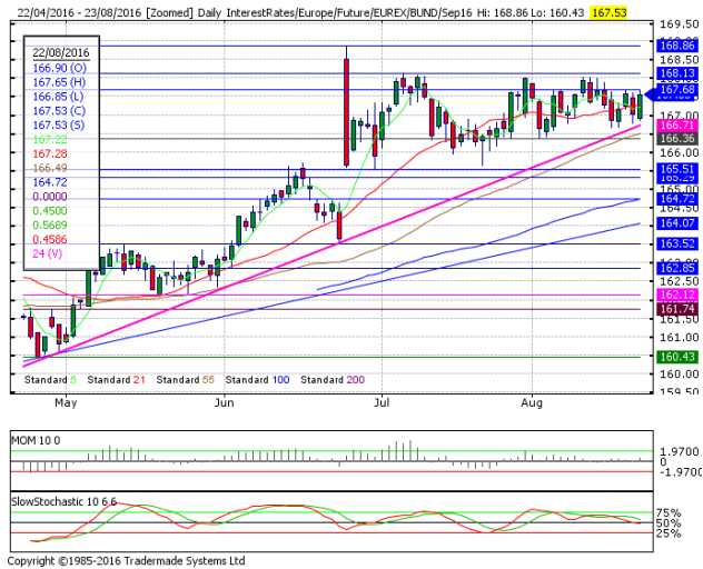
德國 10 年期國債：(U16) 壓力重返初始阻力位

阻力位 4：169.93 周上升通道上軌 1 阻力位 3：168.86 6月24日所創 2016 年和紀錄高點 阻力位 2：168.13 7月6日高點 阻力位 1：167.68 8月18日高點