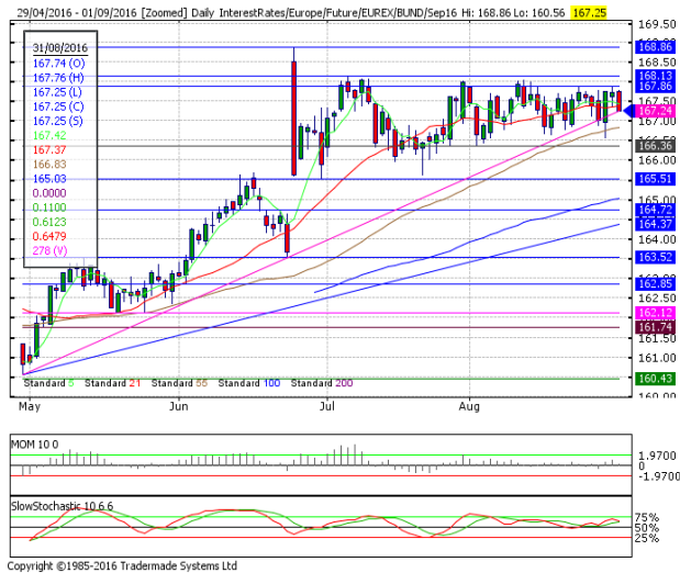
德國 10 年期國債：(U16) 上行失敗令多頭擔憂

阻力位 4：168.13 7月6日高點 阻力位 3：167.97 包寧傑帶狀(Boll band)上軌 阻力位 2：167.86 8月30日高點 阻力位 1：167.52 8月31日小時支撐，現為阻力位