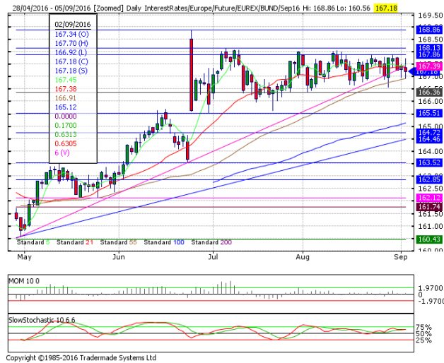
德國 10 年期國債：(U16) 55 日均線繼續提供支撐

阻力位 4：169.07 周包寧傑帶狀(Boll band)上軌 阻力位 3：168.13 7月6日高點 阻力位 2：167.95 包寧傑帶狀(Boll band)上軌 阻力位 1：167.86 8月30日高點