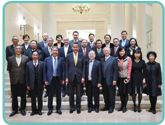
海通國際自2014年起成為「明天會更好基金」的機構會員，矢志對外推廣香港在經濟及社會方面的各項發展

眼見世界各地的公民意識日漸提高，社會問題已不能只以政府政策解決，越來越多社會企業成立，以商業模式處理一些以往難以解決的社會問題，另一方面亦可為社會經濟帶來貢獻。