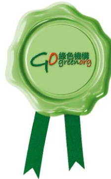
「卓越級別」減廢標誌

自2016年1月1日起，香港交易及結算所有限公司(香港交易所)規定所有上市公司必須按照《環境、社會及管治報告指引》進行匯報，海通國際亦已根據指引制作2016年度的環境、社會及管治報告，並將於2017年推出有關報告介紹公司環境保護政策。