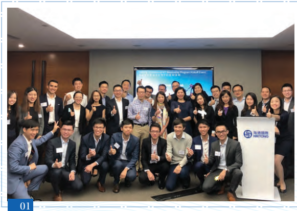
01, 02 管理培訓生友師計劃正式啟動

此外，從2018年開始，與我們的全球戰略相呼應，公司鼓勵員工通過參與海外暫駐和海外交流計劃，為公司的國際業務儲備精英人才。