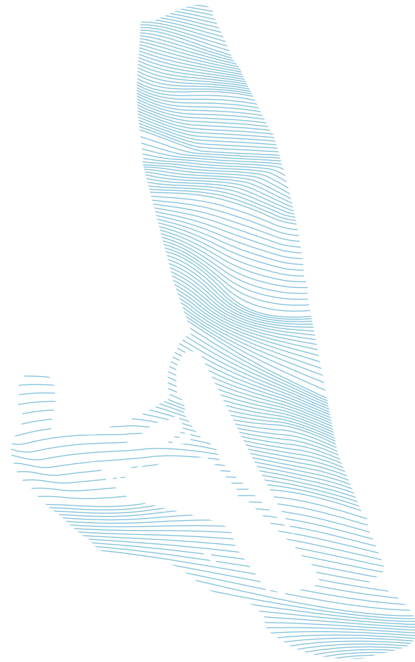
01 海通國際冠名贊助「海通國際2018香港滑浪風帆公開錦標賽」

海通國際慈善基金與「伸手助人協會」自2016年起合辦『海通國際「愛老•愛腦」計劃』，幫助有需要的長者改善情緒及與認知障礙症相關的問題。目前，該計劃已為伸手助人協會轄下5家長者服務單位提供超過330小時的活動時數，受惠的長者數目達5,100人次。