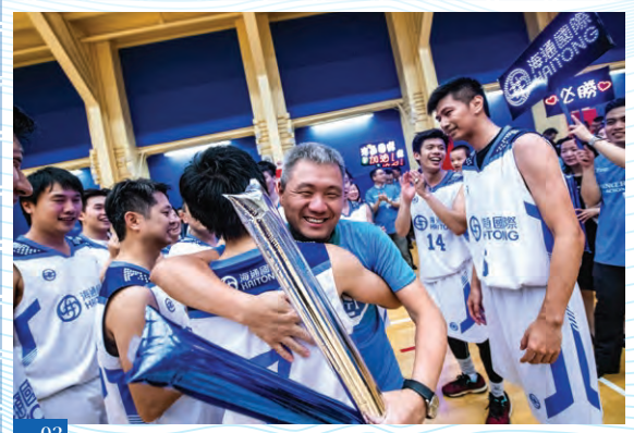
03 海通國際籃球隊勇奪「中資投行盃籃球聯賽」冠軍